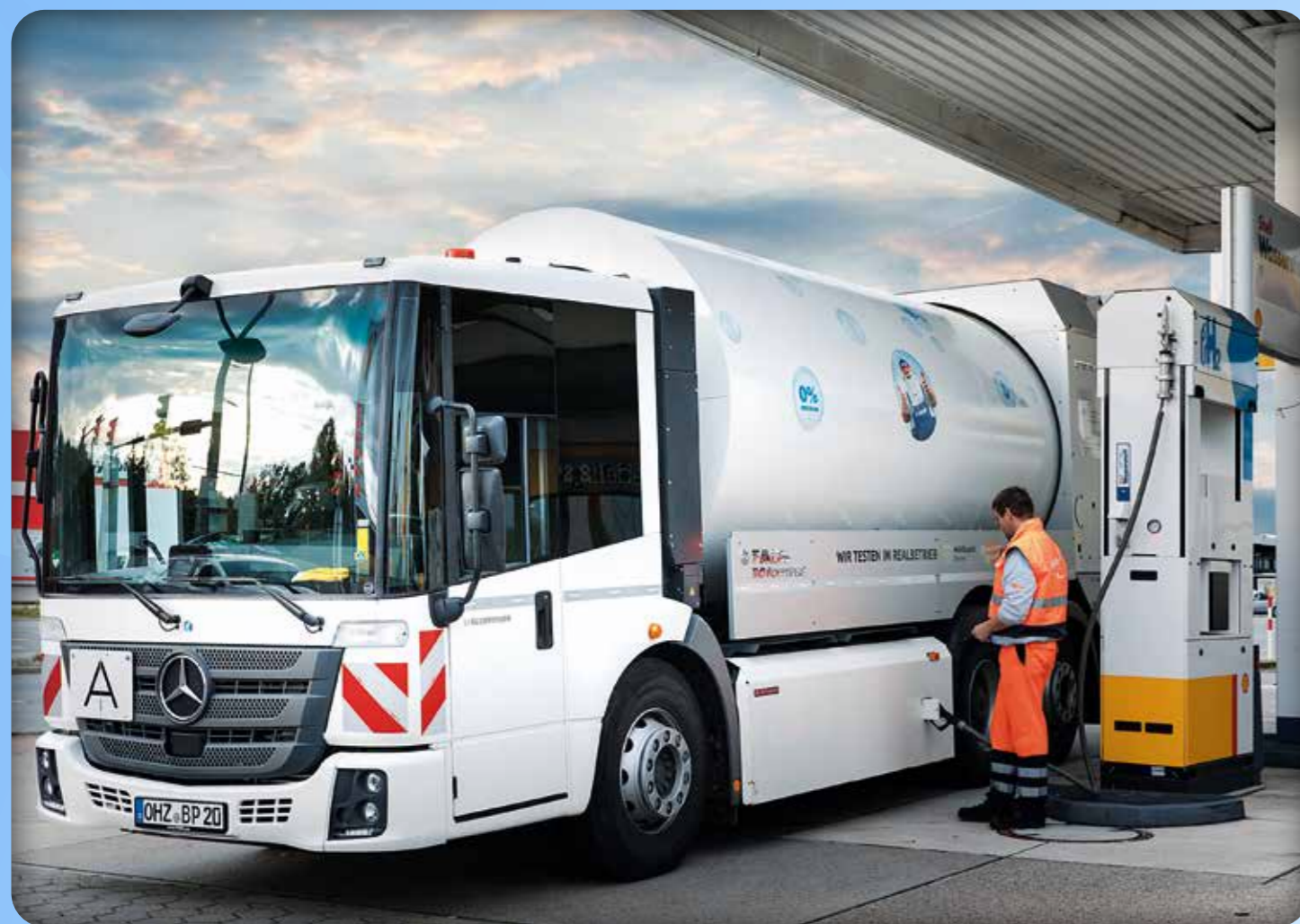
AN DER ZAPFSÄULE: Ein Wasserstoff-Fahrzeug vom Typ „Bluepower“ bekommt an einer Tankstelle in Bremen neuen Treibstoff.

Brennstoffzellen sind übrigens keineswegs eine Erfindung der Neuzeit, auch wenn das häufig vermutet wird. Das physikalische Prinzip wurde bereits 1838 entdeckt, und der berühmte Schriftsteller Jules Verne war von der Technik so begeistert, dass er sie 1875 in seinem Abenteuerroman „Die geheimnisvolle Insel“ beschrieb. >>