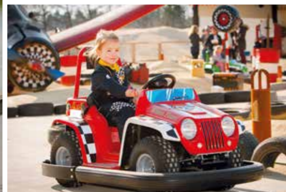
SPASS AUF VIER RÄDERN: In der Kinder-Fahrschule „Wüstenflitzer“ können Kids nach Herzenslust Auto fahren.

für die Teilnahme am Gewinnspiel und die Zusendung eines eventuellen Gewinns notwendig. Teilnahmebedingungen in Langform: aktivimnorden.de/tn-kreuzwort