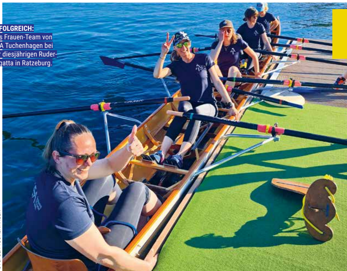
ERFOLGREICH: Das Frauen-Team von GEA Tuchenhagen bei der diesjährigen Ruder- Regatta in Ratzeburg.