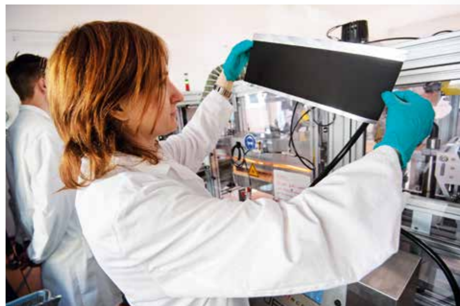
BESCHICHTETE ELEKTRODE: Auch Fraunhofer-Forscher treiben die Batterietechnik voran.

Aktuell gibt es deshalb auf dem Kontinent mehr als 40 Projekte für Batteriezell-Fabriken. Sie heißen auch „Gigafactories“, weil sie pro Jahr Zellen mit mehreren Gigawattstunden Kapazität fertigen. Die Produktionsfähigkeit in Europa wird, wie der Infodienst „Battery News“ im Juli meldete, bis 2030 auf rund 1.400 Gigawattstunden wachsen. Allein in Deutschland sollen 480 Gigawattstunden entstehen. Das entspricht 480 Millionen Kilowattstunden (kWh). Fertigt man mit diesen Zellen 75-kWh-Akkus, reicht das für 6,4 Millionen Autos. Zum Vergleich: In Spitzenjahren produzierte Deutschlands Vorzeigebbranche 5,7 Millionen Pkws.