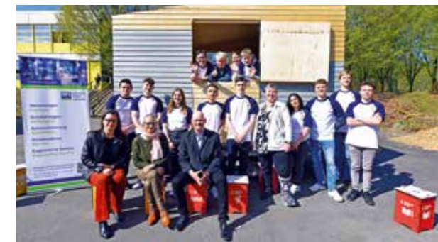
PRÄMIERT: Das Tiny House mit Schülern und Betreuern.

Arbeiten halfen. Der Einsatz wurde belohnt – das Projekt, das im Rahmen des Förderprogramms „Lüttling“ stattfand, erhielt beim Abschluss-Event in Kiel den ersten Preis der Jury und eine Prämie von 5.000 Euro. Nun folgt die Vermarktung: Die Schüler wollen ihr Tiny House vermieten und kümmern sich eigenständig um die Organisation.