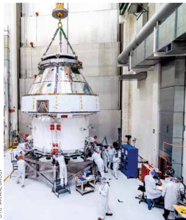
MONTAGE: Arbeiten an der Oberstufe der Trägerrakete „Ariane 6“, die 2023 in Kourou zum Erstflug starten soll.

Die Stadt an der Weser zählt heute weltweit zu den wichtigsten Raumfahrt-Standorten – der Aufstieg begann vor sechs Jahrzehnten