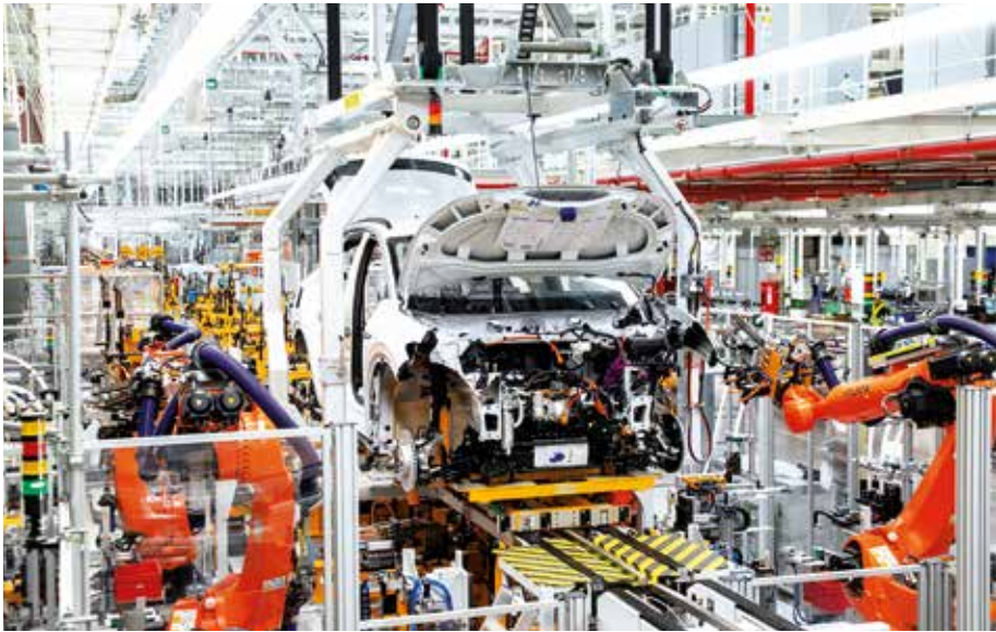
VW IN EMDEN: Der Mittelklasse-SUV ID.4 wird dort und in Zwickau produziert.